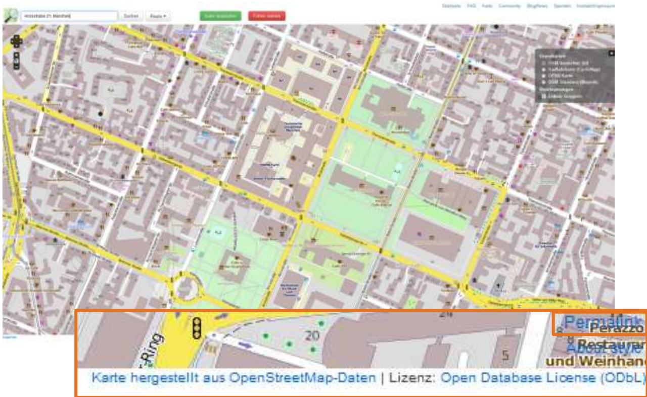
Karte 1: Arcisstraße 21, München (Open Street Maps, 2016) veröffentlicht unter Open Database License ODbL

Wenn Sie viele Karten in Ihrer Arbeit verwenden, legen Sie in Ihrer Arbeit ein Kartenverzeichnis an, in dem alle Karten aufgeführt sind.