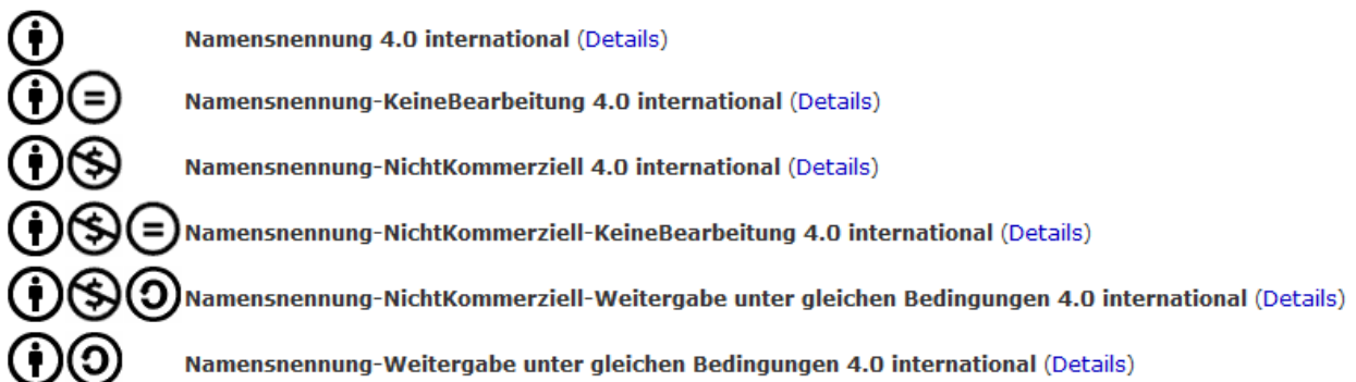
Abbildung 3: „Auswahl von insgesamt sechs verschiedenen CC-Lizenzen, die dem Rechteinhaber derzeit in der Version 4.0 zur Verfügung stehen“ ("Was ist CC?," 2014)

Folgende sechs Lizenzen stehen derzeit zur Verfügung 19 .