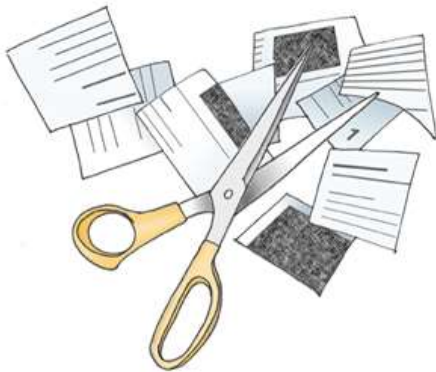
Abbildung 2: Wie wird plagiiert? (Weber-Wulff, 2004b)

Das im Kurzbeleg genannte Werk muss im Literaturverzeichnis aufgeführt werden.