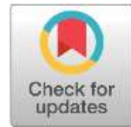
Abbildung 6: CrossMark-Button (Meddings, 2016)